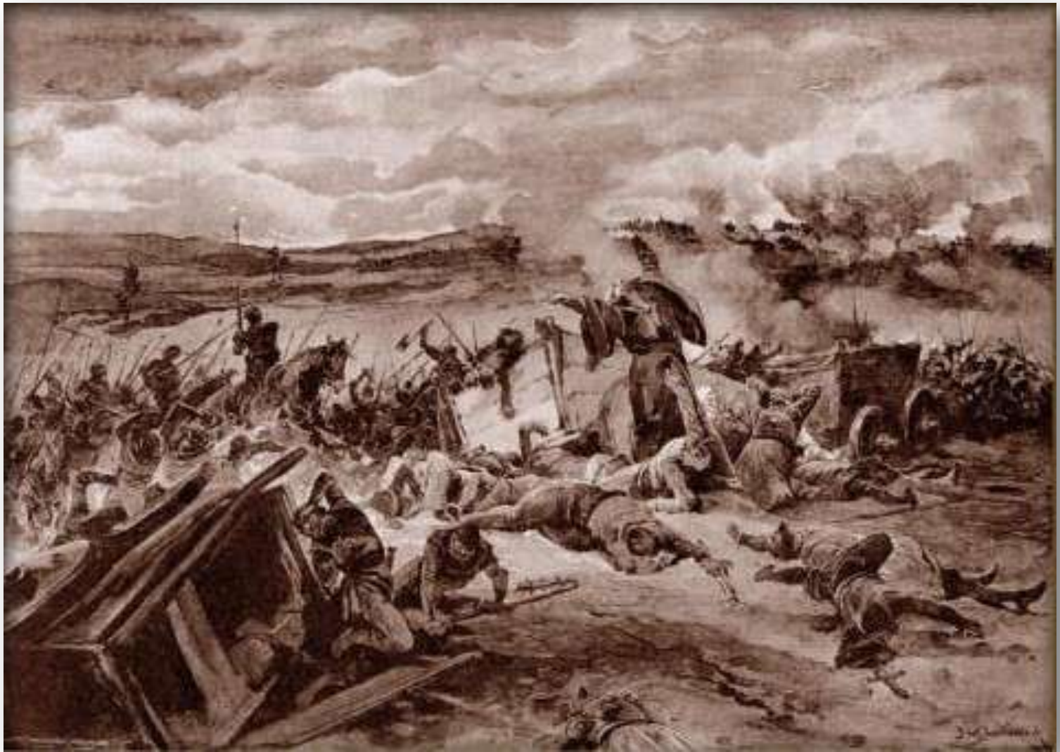
Bitva u Lipan