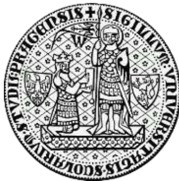
Pečeť Univerzity Karlovy