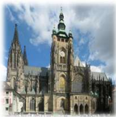
Chrám sv. Víta